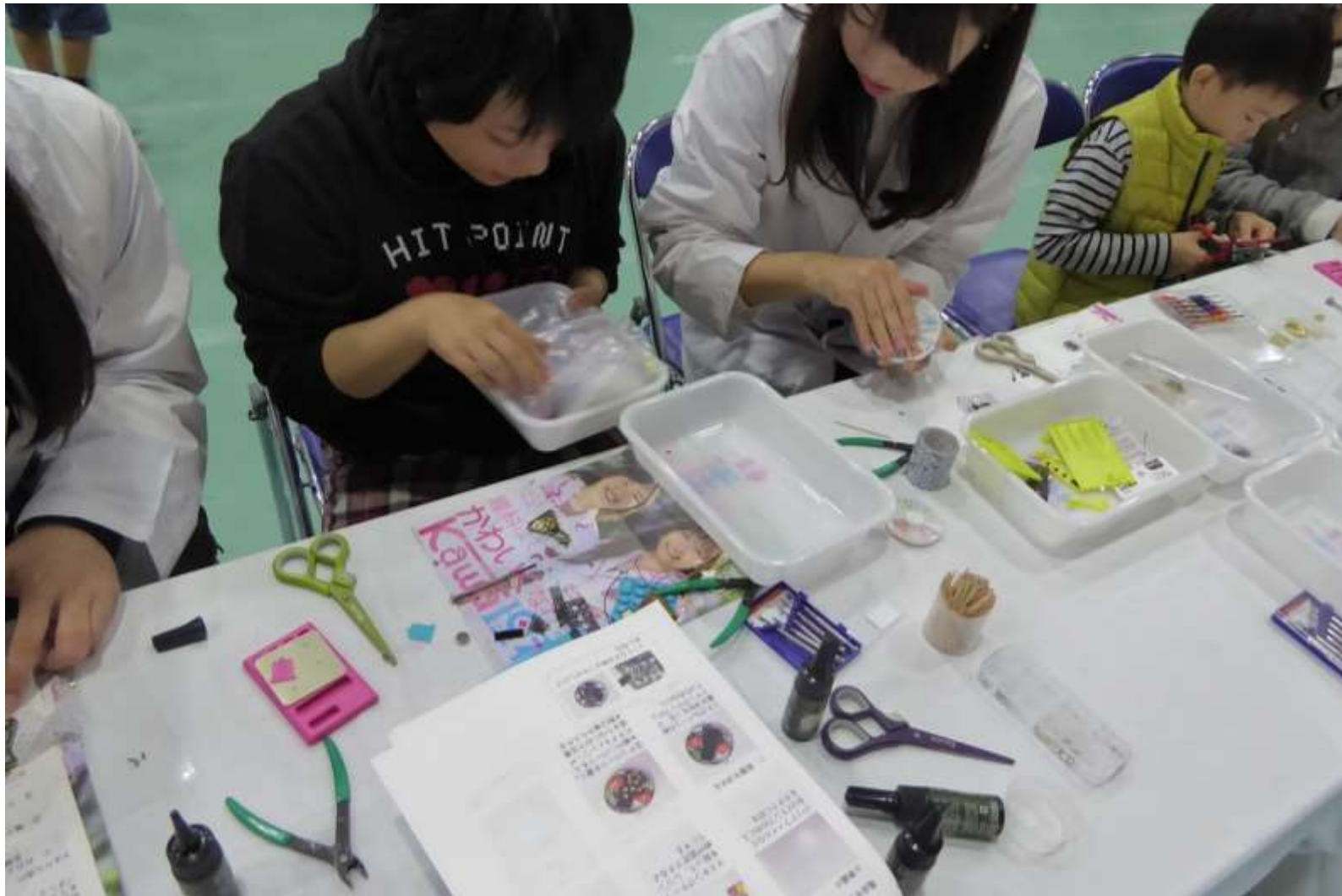
2015/11/07-08 香川高専 高専祭 分解アクセサリ