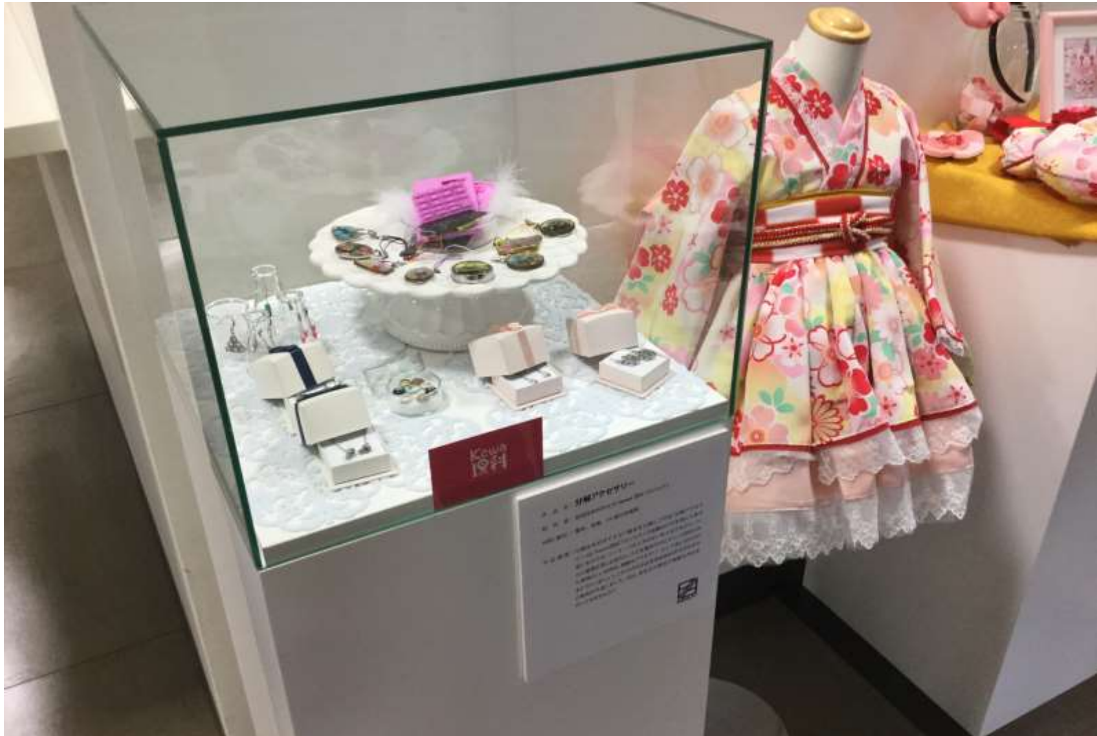
2015/09/01-11/30 三条市, 燕三条地場産業振興センター「燕三条ブランキングアート展」