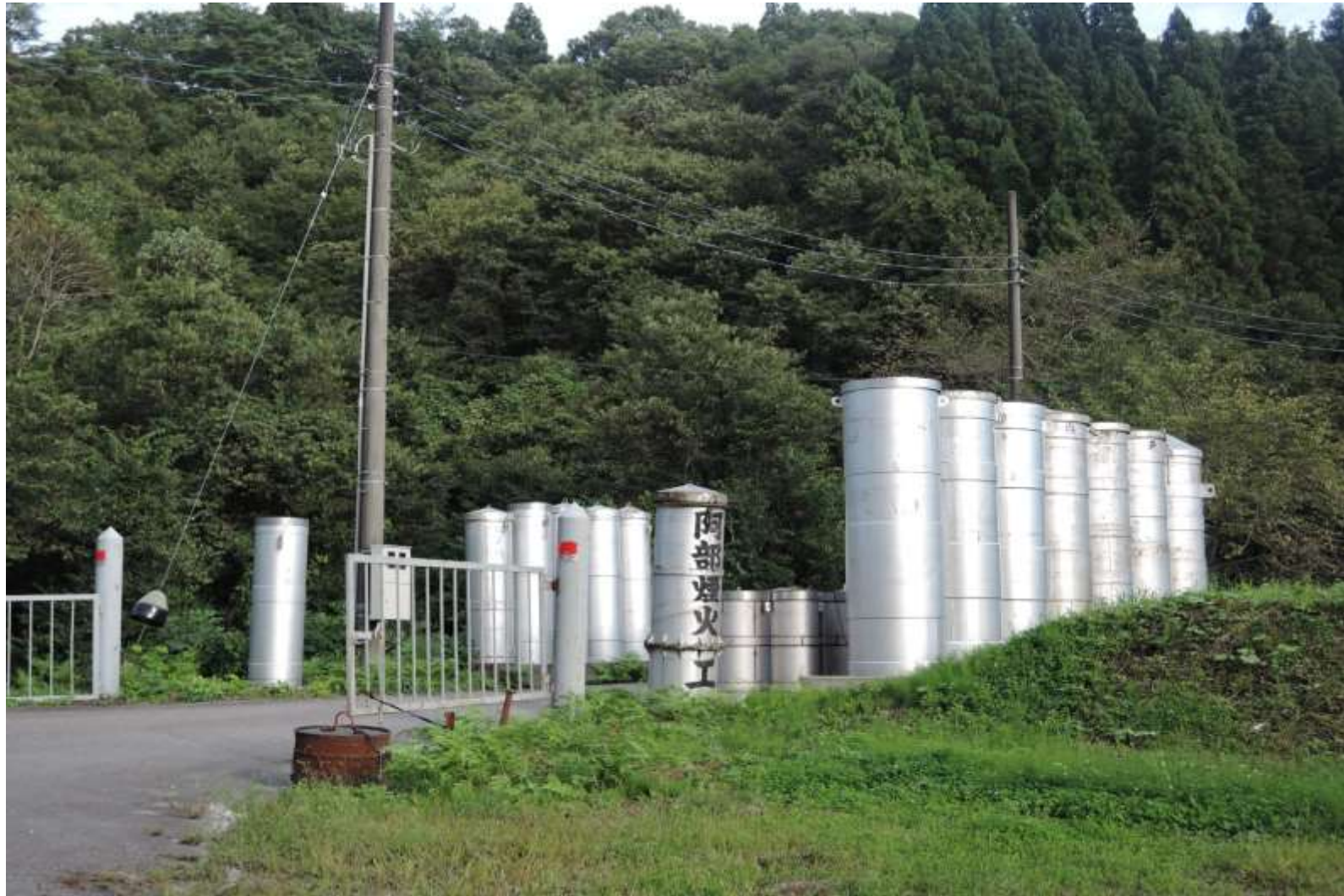
2015/09/30 加茂市, 阿部煙火工業 土倉工場, 見学会