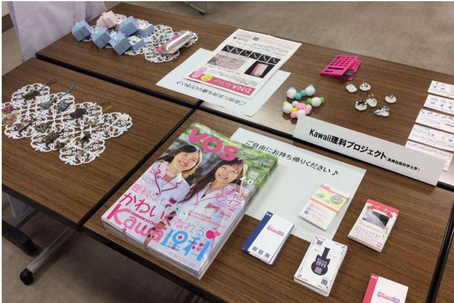
2015/10/18 新潟大学新大祭 ザ・ビヨンド