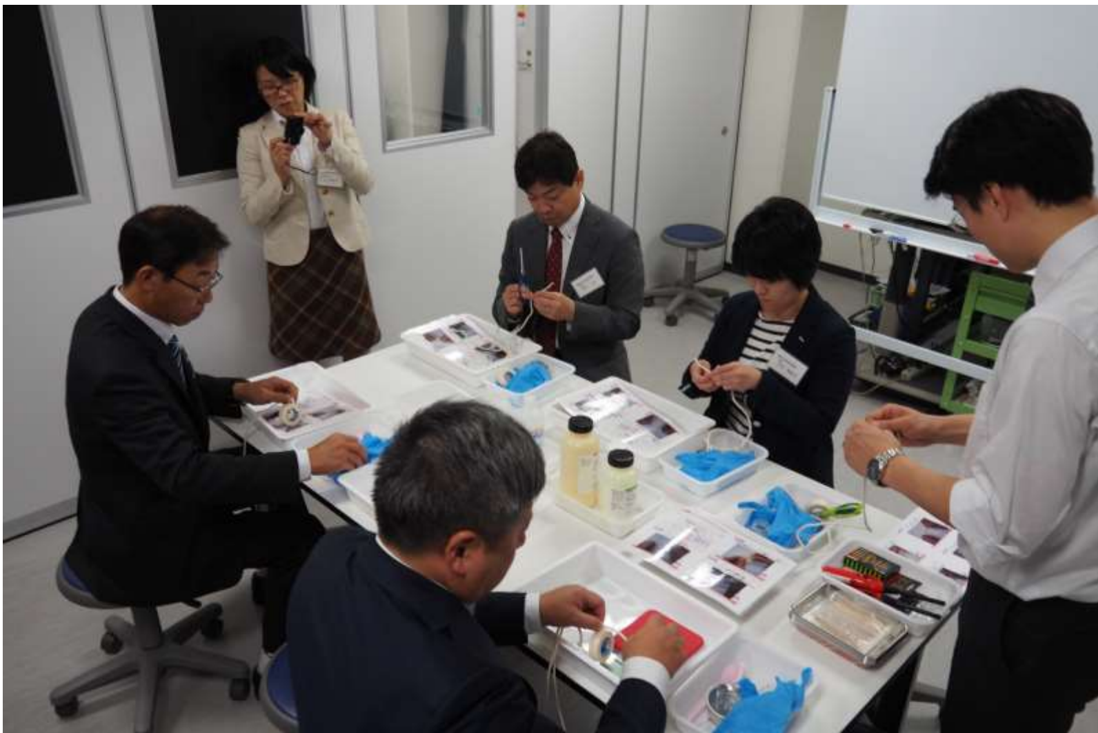
2015/10/13 小中学校教員研修 炎色反応キャンドル