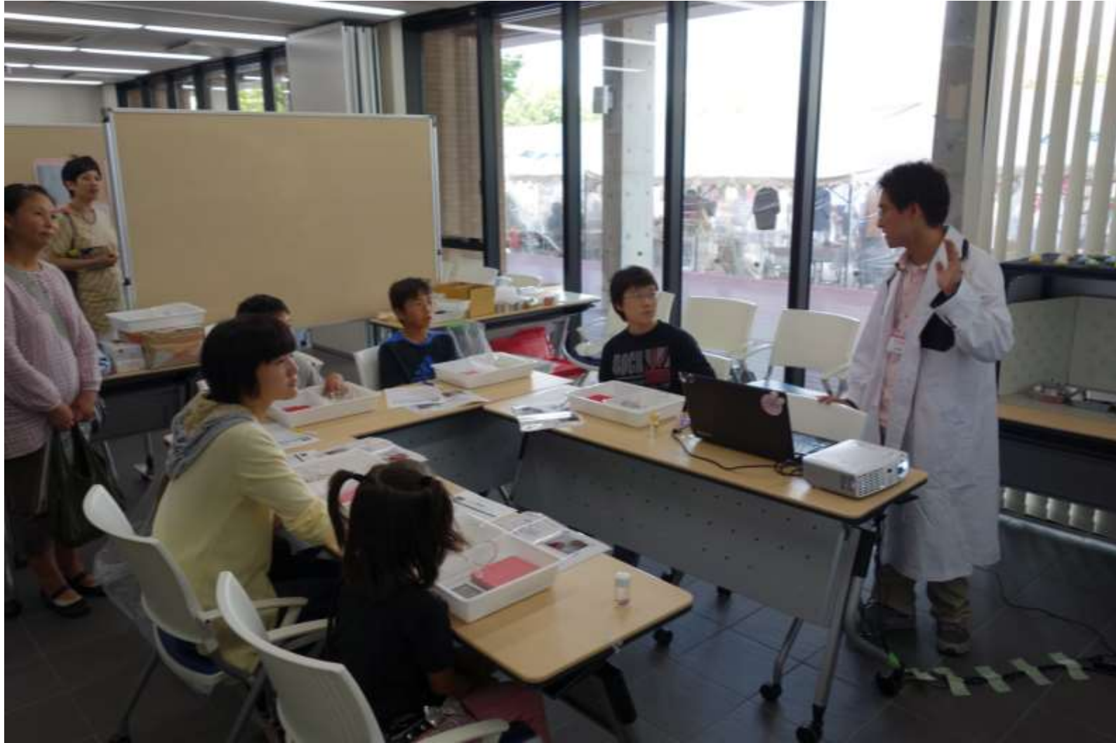
2015/09/20-21 技大祭 炎色反応キャンドル