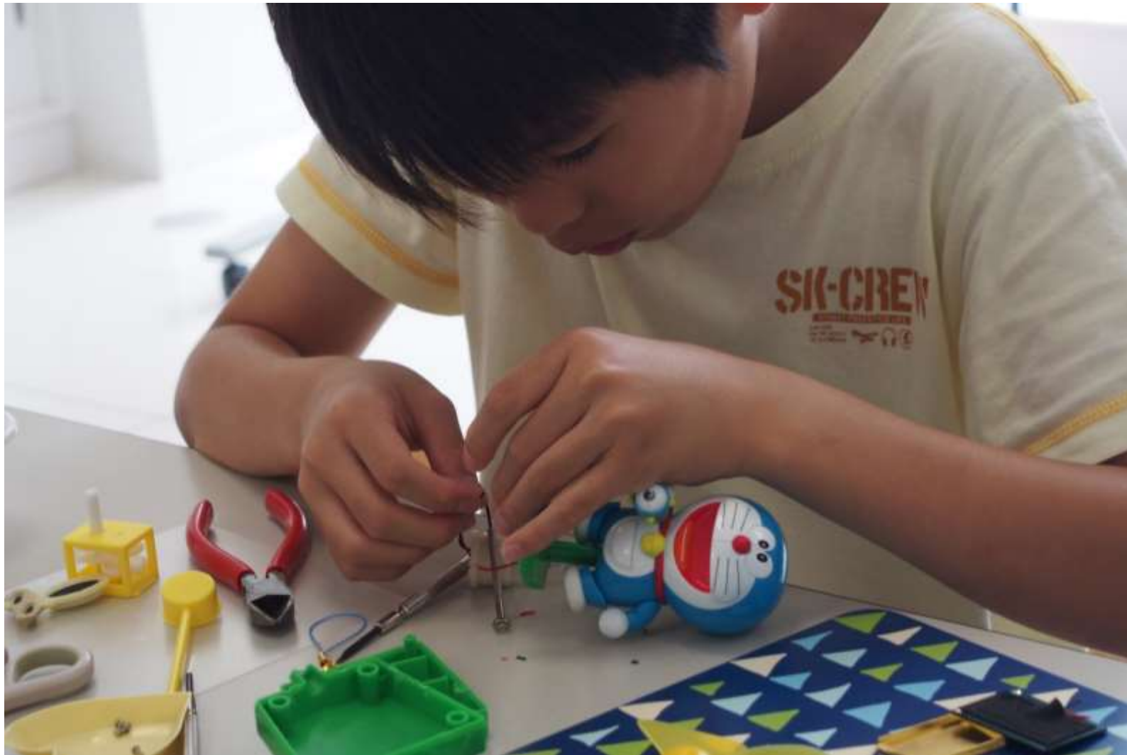
2015/07/20 まちキャンこどもカフェ「分解しまくり隊」分解アクセサリ（電卓以外にもいろいろ）