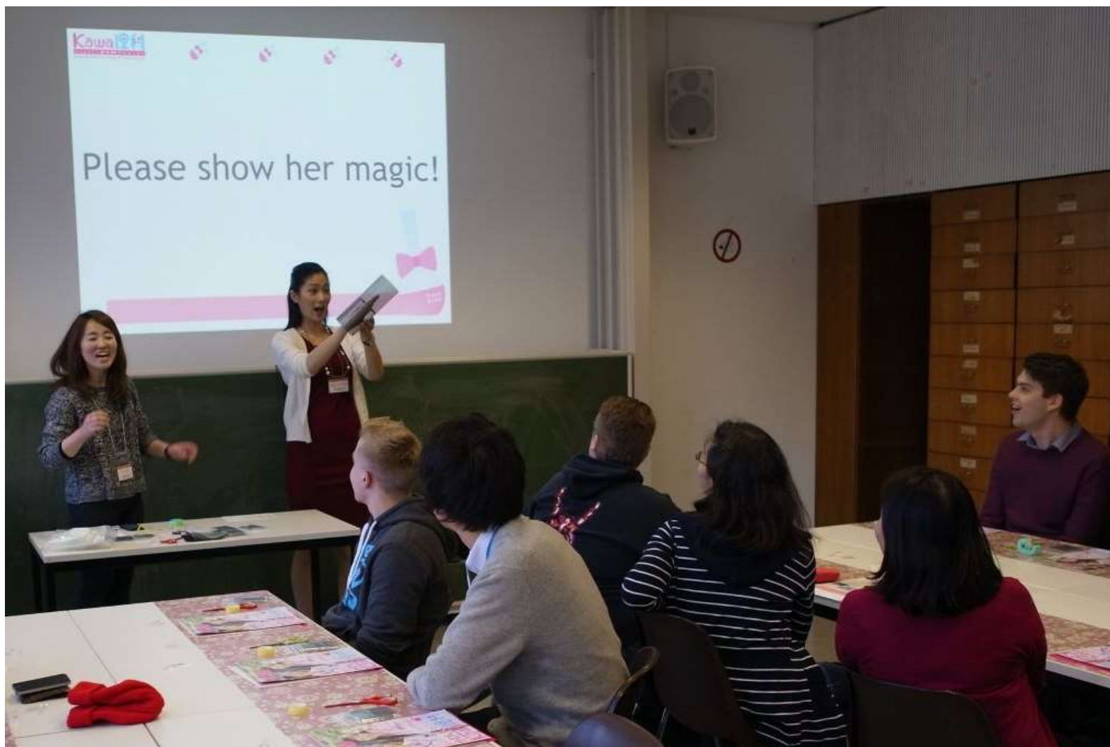
2016/01/08 Kawaii 理科プロジェクト実験教室 in ドイツ @University of Duisburg-Essen (Duisburg キャンパス)