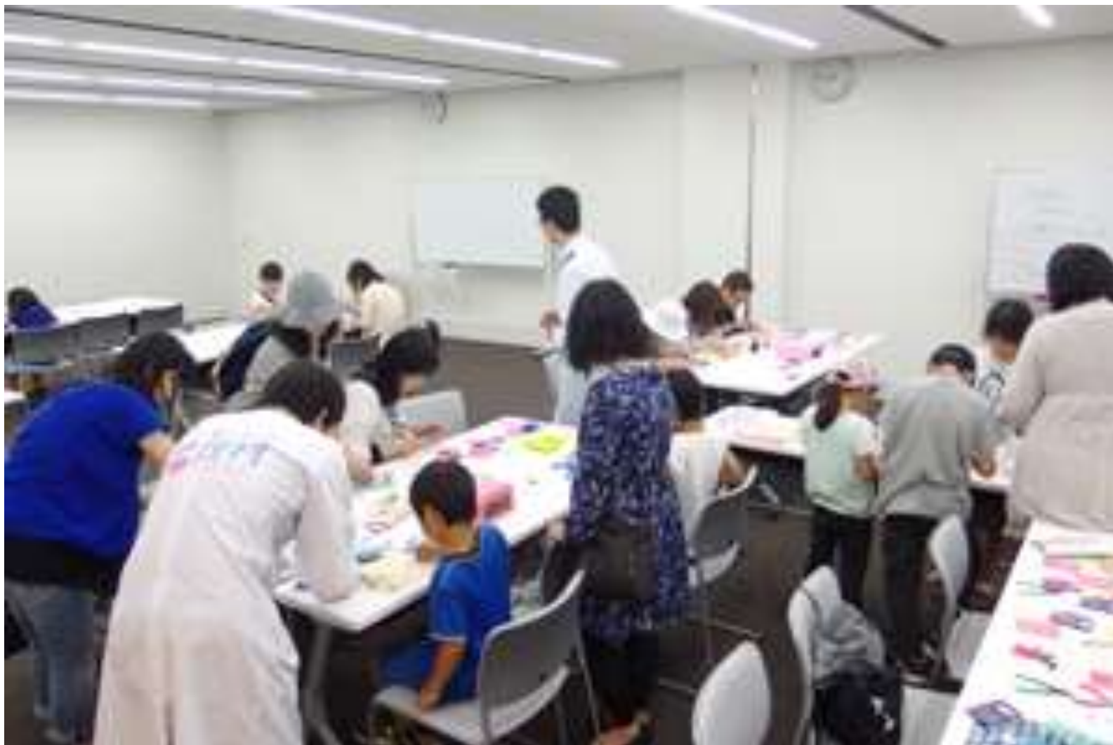
2015/05/30 アオーレ長岡「ロボットにふれて、未来を語ろう」にて DNA ストラップ 分解アクセサリー