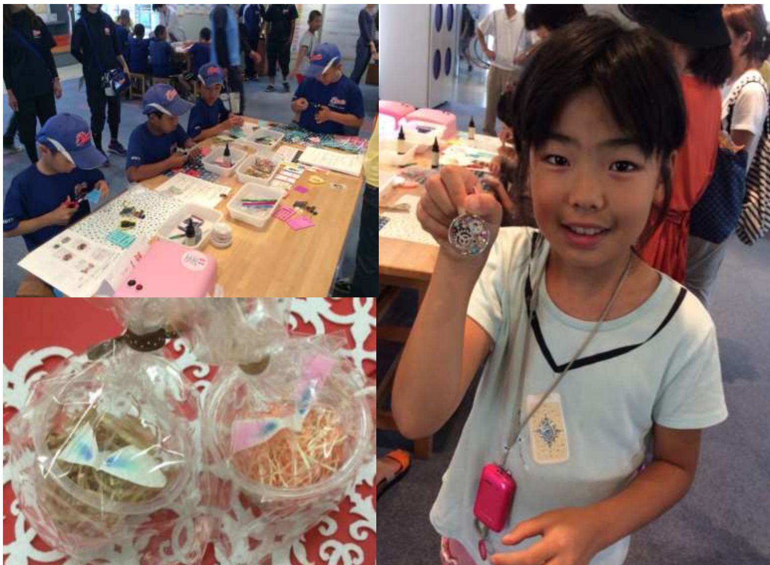
2015/08/15-16 「ワンダー・ラボ科学実験フェスタ」 分解アクセサリー DNAストラップ ペーパークロマトグラフィー