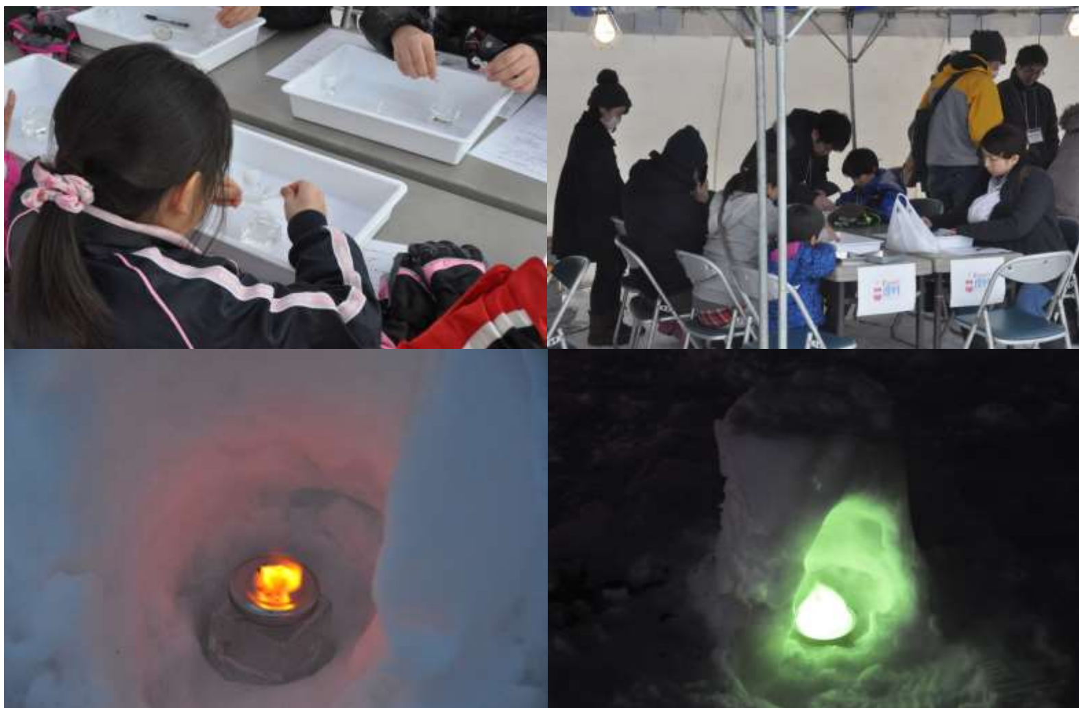
2016/02/27 長岡市, 「越後川口雪洞火ぼたる祭」, Kawaii 理科プロジェクトブース出展 (実験教室)