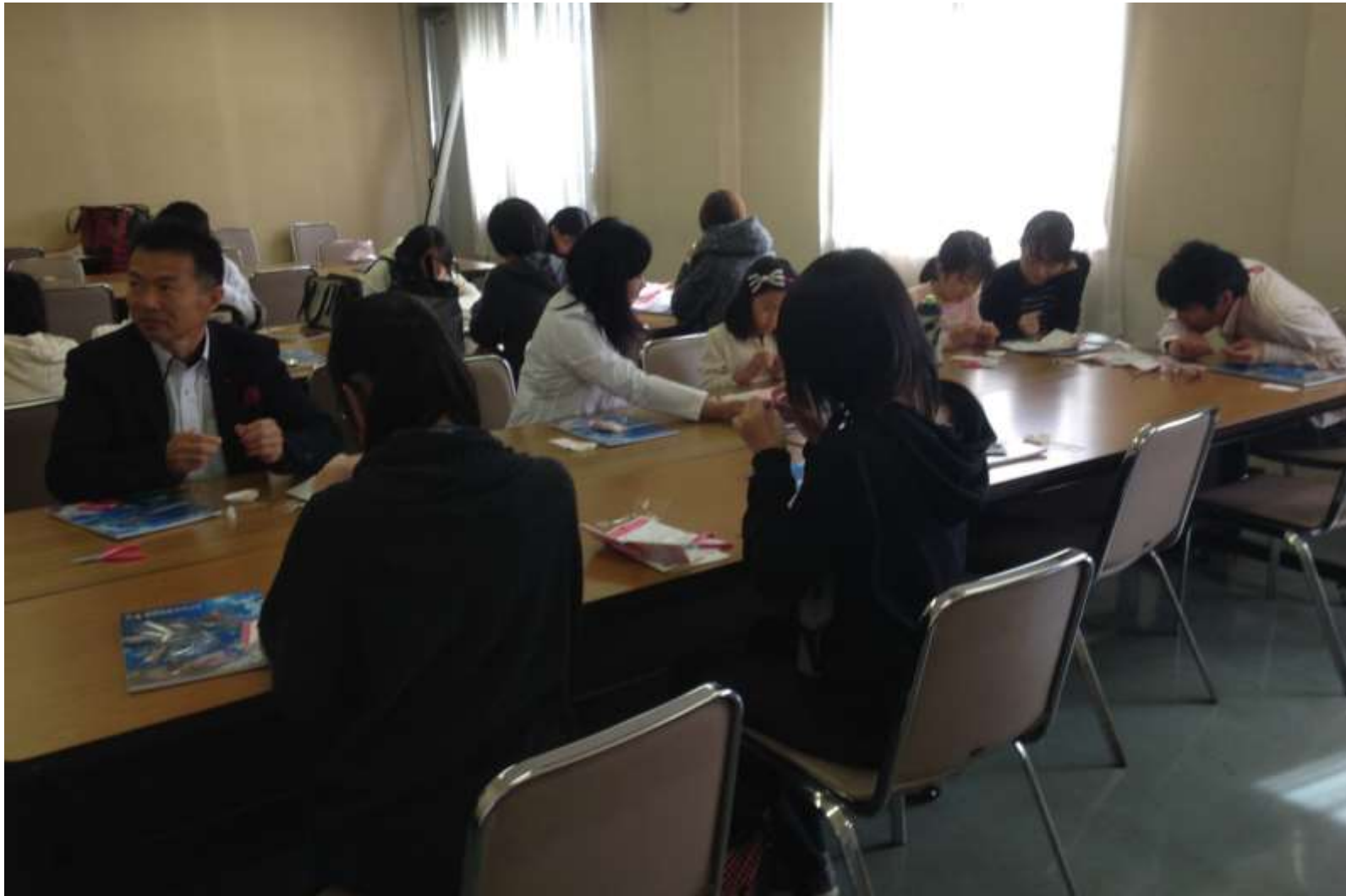
2015/10/31-11/1 神戸高専 高専祭 DNA ストラップ