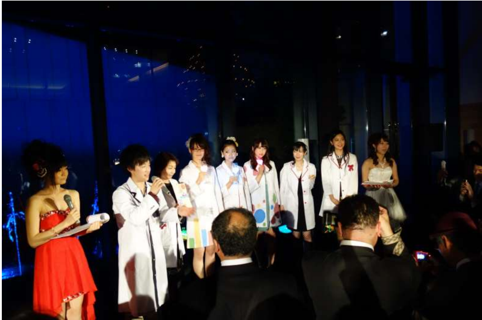
2015/05/10 リリマリパーティ 白衣のファッションショー