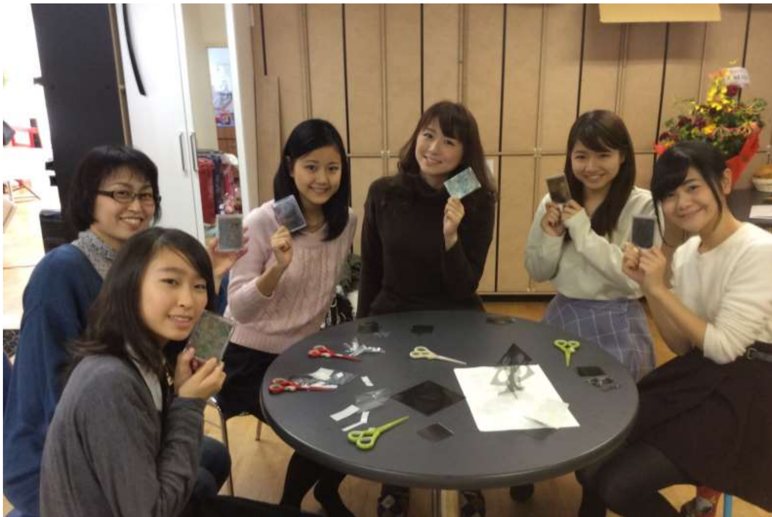
2015/12/19 Kawa 理科実験教室@リリマリ