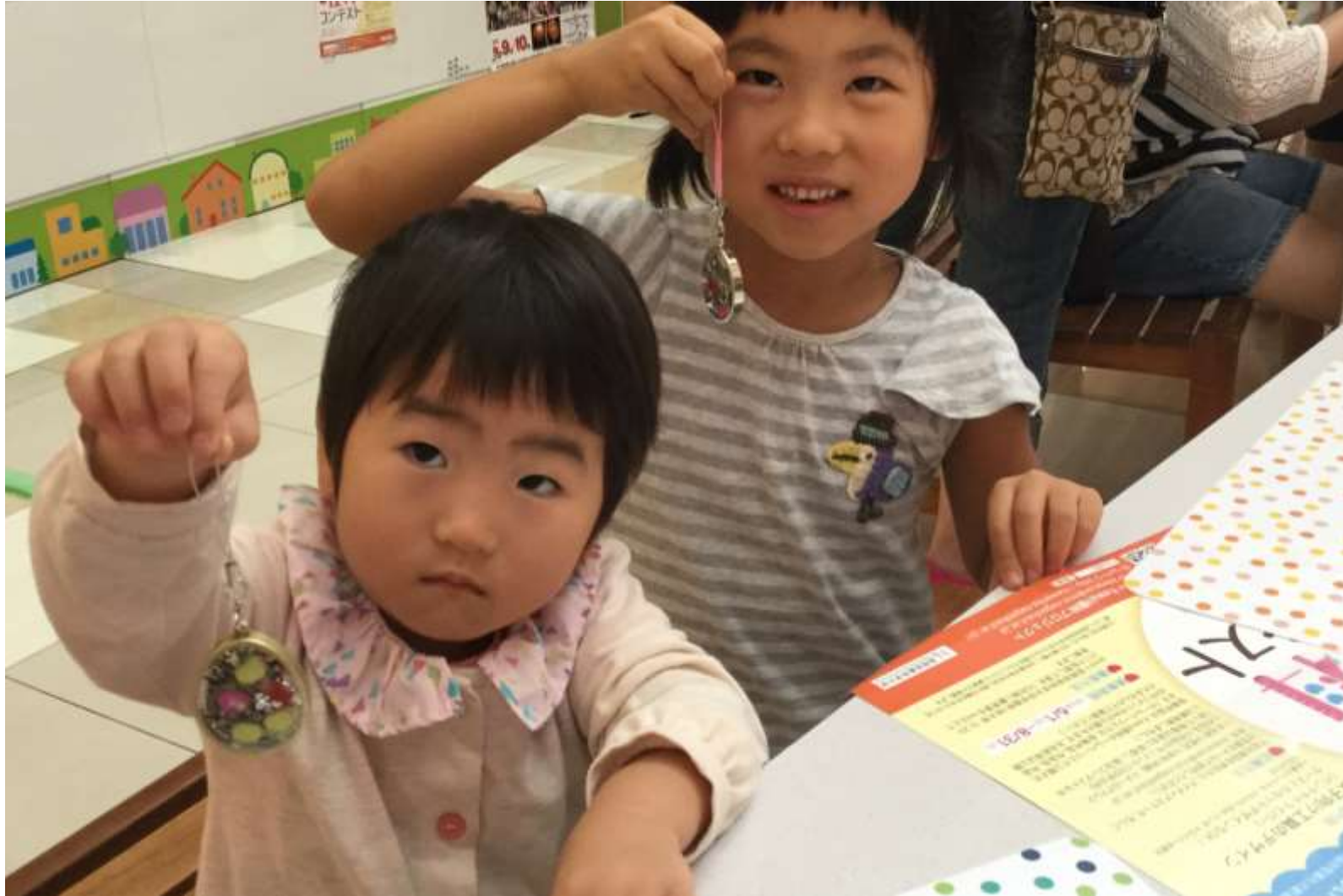
2015/08/10-11 「リバセン de 科学実験 ～TEC & Kawaii 理科プロジェクト～」 分解アクセサリ