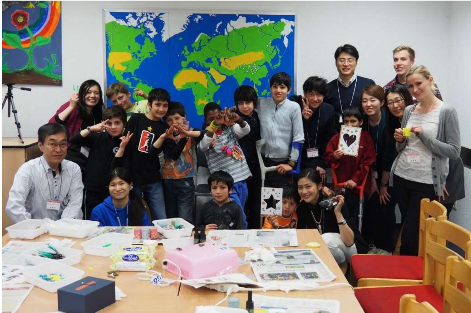
2016/01/07 Kawaii 理科プロジェクト実験教室 in ドイツ @国際平和村